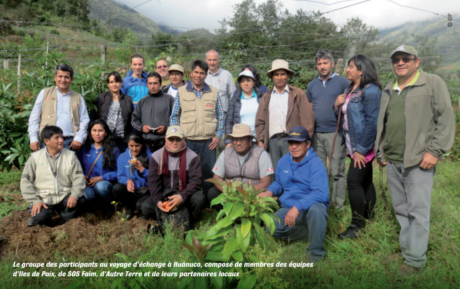
Le groupe des participants au voyage d'échange à Huánuco, composé de membres des équipes d'Iles de Paix, de SOS Faim, d'Autre Terre et de leurs partenaires locaux