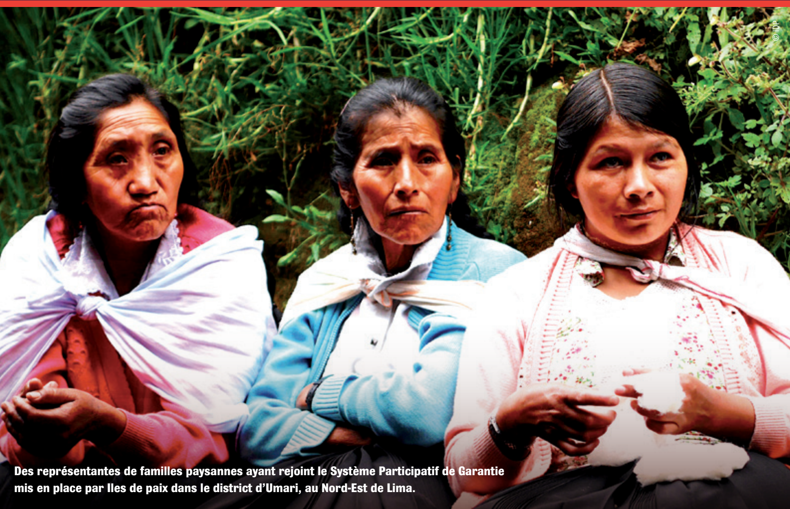
Des représentantes de familles paysannes ayant rejoint le Système Participatif de Garantie mis en place par l'les de paix dans le district d'Umari, au Nord-Est de Lima.