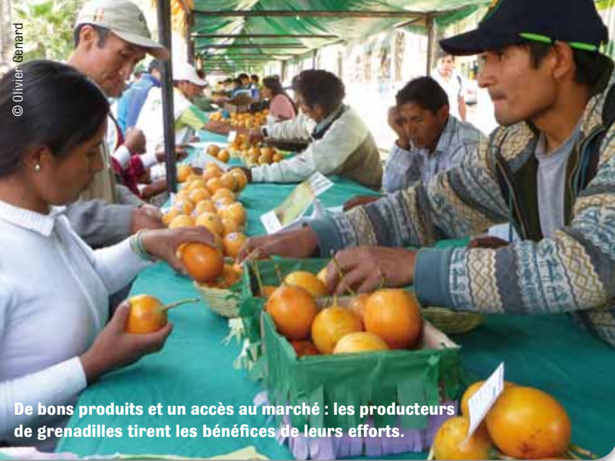
De bons produits et un accès au marché : les producteurs de grenadilles tirent les bénéfices de leurs efforts.

L'agriculture s'est mondialisée, et cela a un impact sur les prix offerts au paysan, au Nord comme au Sud. Le problème, pour l'agriculteur, est de bien se positionner sur ses marchés, proches ou lointains : proposer un produit de bonne qualité et trouver les bonnes filières pour le vendre bien.