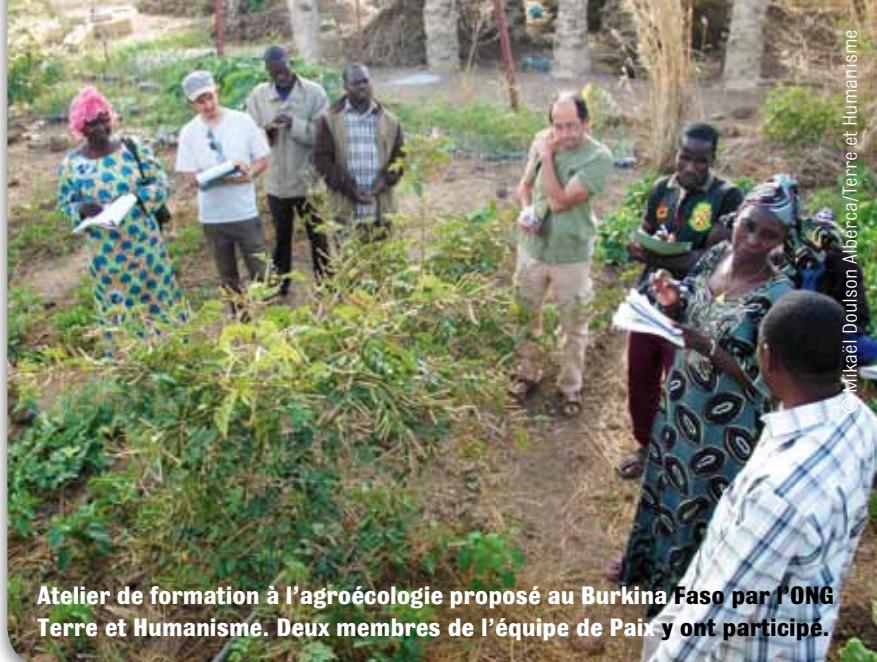
Atelier de formation à l'agroécologie proposé au Burkina Faso par l'ONG Terre et Humanisme. Deux membres de l'équipe de Paix y ont participé.

Face aux impasses environnementales et financières auxquelles se heurte l'agriculture, la piste de l'agroécologie apparaît à un nombre croissant de paysans et de spécialistes de l'agronomie comme une piste prometteuse.