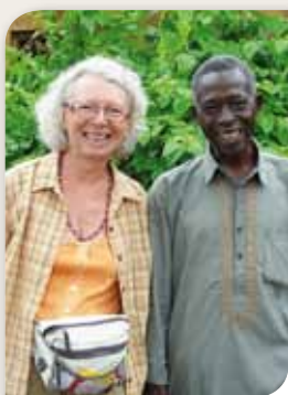
Sur les bancs d'une école burkinabè.