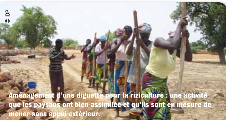
Aménagement d'une diguette pour la riziculture : une activité que les paysans ont bien assimilée et qu'ils sont en mesure de mener sans appui extérieur.

Dominique Pire, fondateur de notre association, disait : Il faut partir dès que la communauté a atteint un point à partir duquel elle peut assumer elle-même son développement. Contribuer à un développement durable implique que dès son arrivée, un organisme d'aide commence à préparer son départ.