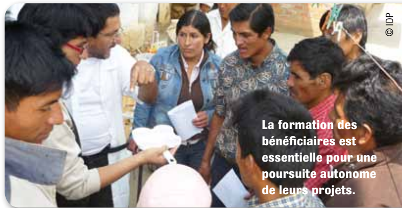
La formation des bénéficiaires est essentielle pour une poursuite autonome de leurs projets.

Iles de Paix a balisé ses interventions dans le temps. 10 à 12 ans dans une région, 5 à 8 ans dans une commune ou sur une thématique particulière (le maraîchage, par exemple). Cela peut paraître très formel ou radical, mais il est important de ne pas « s'incruster » car on risquerait alors de voir s'installer une dépendance contreproductive. Il faut susciter des dynamiques locales et faire en sorte qu'elles puissent prendre le relais, aller plus loin en toute autonomie.