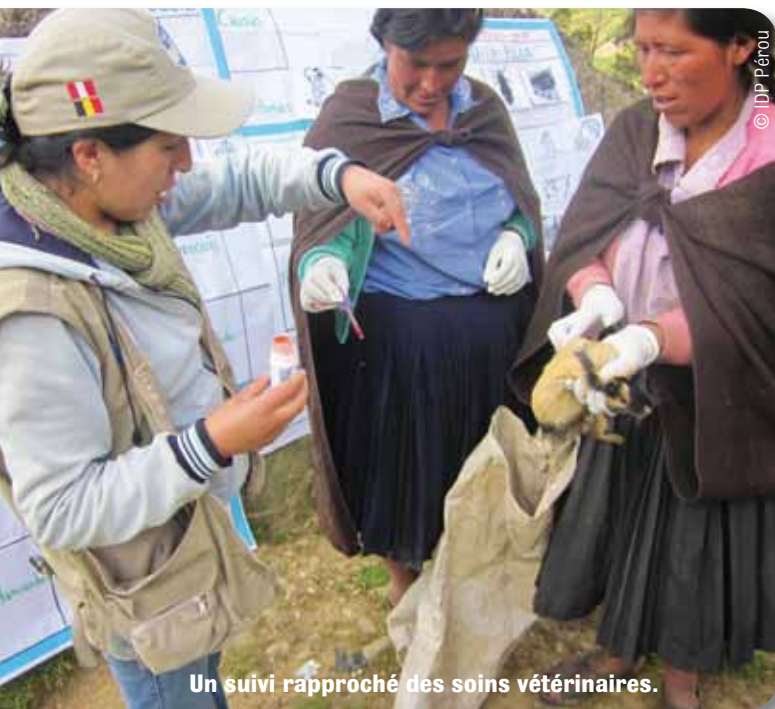
Un suivi rapproché des soins vétérinaires.

Peu à peu cependant, les femmes se sont émancipées. Les formations que nous leur avons prodiguées y ont contribué. Formations en estime de soi, en motivation et en leadership pour les techniciennes de terrain que nous avons formées. Ces dernières ont une bonne maîtrise de l'activité et elles concourent à son autonomisation. Cela, c'est un grand changement. ●