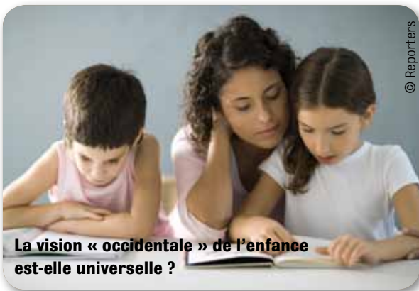
La vision « occidentale » de l'enfance est-elle universelle ?

Considérer d'autres points de vue n'est pas, pour Iles de Paix, une manière de dénigrer cette approche, mais d'en souligner le relativisme spatial et temporel et d'inviter à la réflexion et au choix libre de ses options intellectuelles.