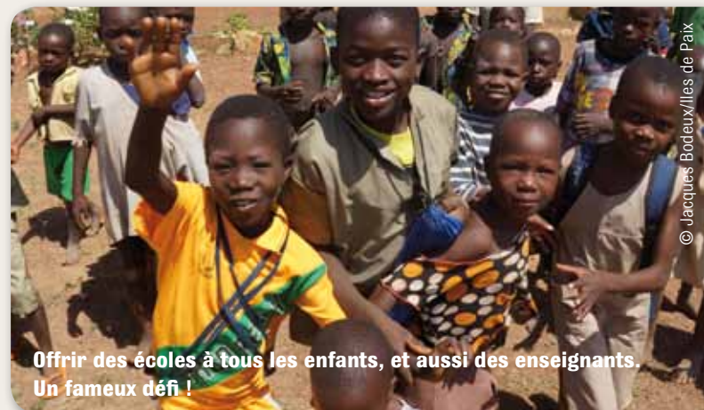
Offrir des écoles à tous les enfants, et aussi des enseignants. Un fameux défi !

En tout cas, merci à Iles de Paix ! Les mots me manquent pour saluer ce que l'association a réalisé. Tellement d'élèves et d'enseignants travaillaient sous le manguier !