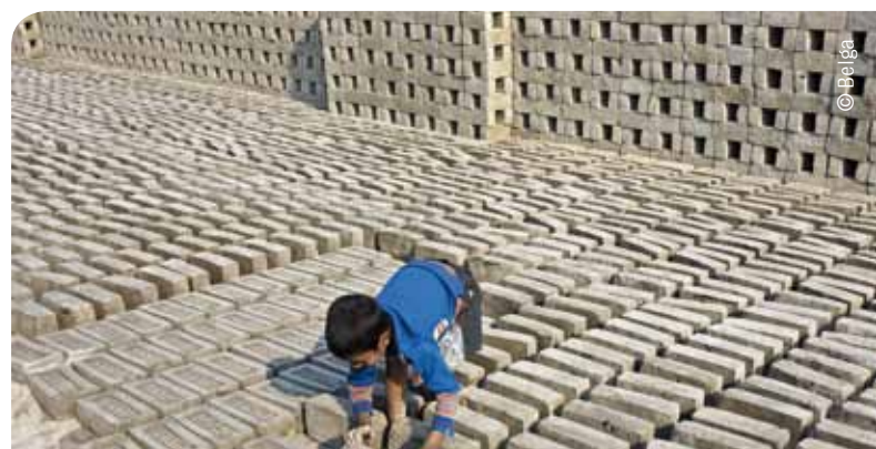
La situation de certains enfants travailleurs est intolérable. Toute activité est-elle pour autant condamnable ?

Troisièmement, l'enfant travailleur est renvoyé au rang de victime, quelle que soit son activité. Or, on sait que de nombreuses activités économiques assidues ne sont pas