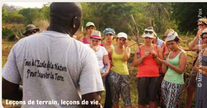
Leçons de terrain, leçons de vie.

Un petit pas plus loin, de tels voyages favorisent la prise de conscience que chacun est en mesure de contribuer à faire changer certaines choses et influencer positivement les conditions de vie des populations des pays en développement. Encore faut-il agir utilement. Le champ des actions que l'on peut mener est vaste et il est important d'identifier celles qui sont les plus efficaces et les plus pertinentes. Ces objectifs sont évidemment ambitieux et tous les jeunes voyageurs ne parcourent pas toutes ces étapes. Une préparation préalable et un accompagnement de qualité sur le terrain leur donnent en tout cas de bonnes chances de les franchir.