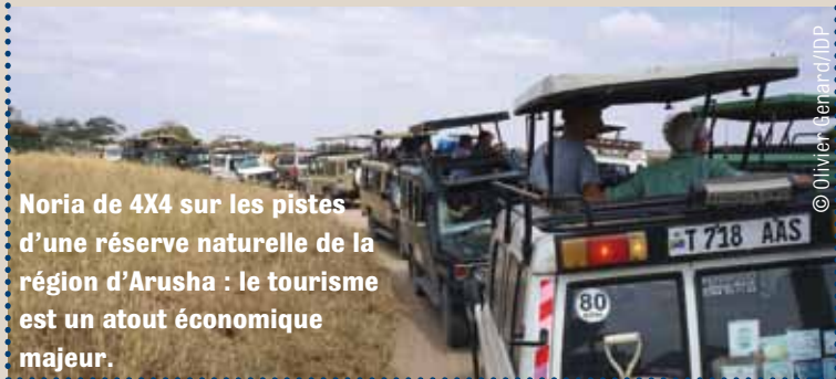
Noria de 4X4 sur les pistes d'une réserve naturelle de la région d'Arusha : le tourisme est un atout économique majeur.

Notons que l' industrie représente 25,1 % du PIB et les services 47,2 %.