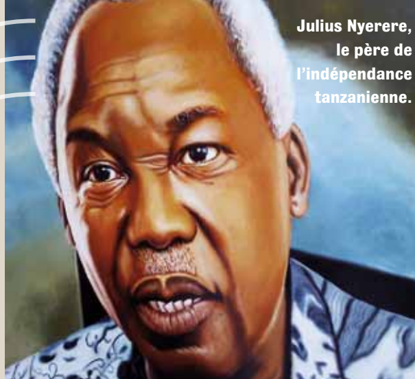
Julius Nyerere, le père de l'indépendance tanzanienne.

Monnaie > le shilling tanzanien n'est arrimé à aucune autre monnaie