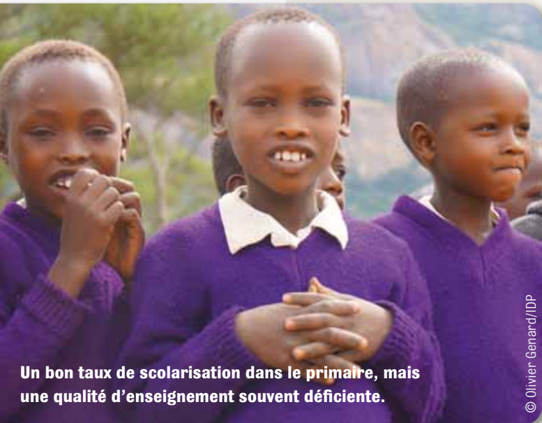
Un bon taux de scolarisation dans le primaire, mais une qualité d'enseignement souvent déficiente.

Le pays est face à de nombreux défis dans différents secteurs.