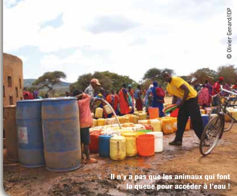
Il n'y a pas que les animaux qui font la queue pour accéder à l'eau !