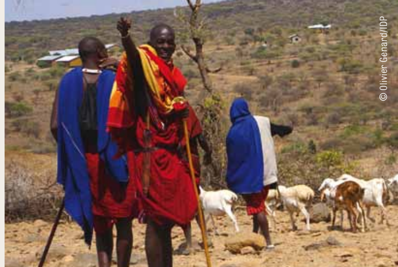
Touchés par la pauvreté et l'insécurité alimentaire, les éleveurs massaï seront au cœur du programme piloté par le FBSA.

Ici, il se trouve que dans la zone que nous avons choisie, les Massaï constituent 90 % de la population et qu'ils sont particulièrement vulnérables. Ils sont notamment très touchés par le manque de terres et par la sécheresse.