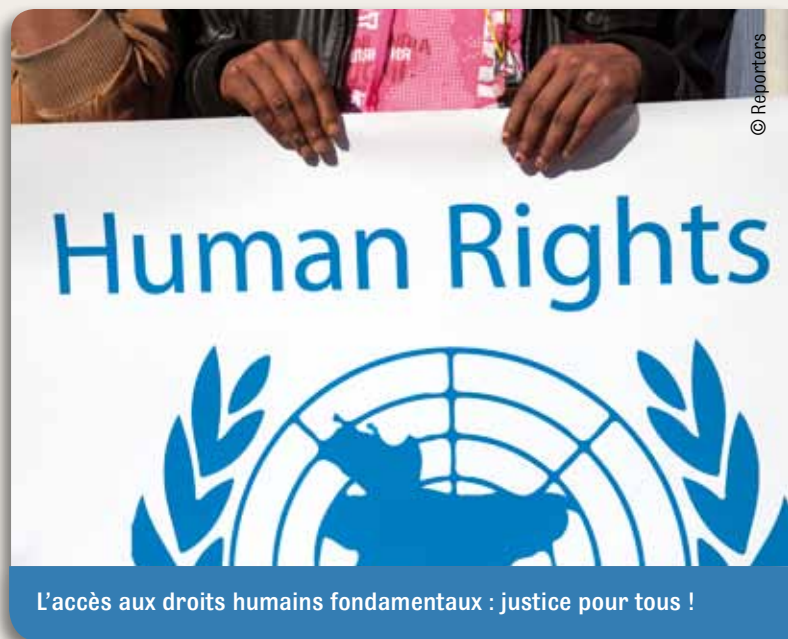
L'accès aux droits humains fondamentaux : justice pour tous !

Les appréciations sur l'avenir du secteur de la coopération au développement sont nombreuses. Il semble toutefois exister une convergence pour souligner la nécessité de reformuler la mission des ONG de coopération au développement. Il s'agirait désormais d'œuvrer pour la justice globale.