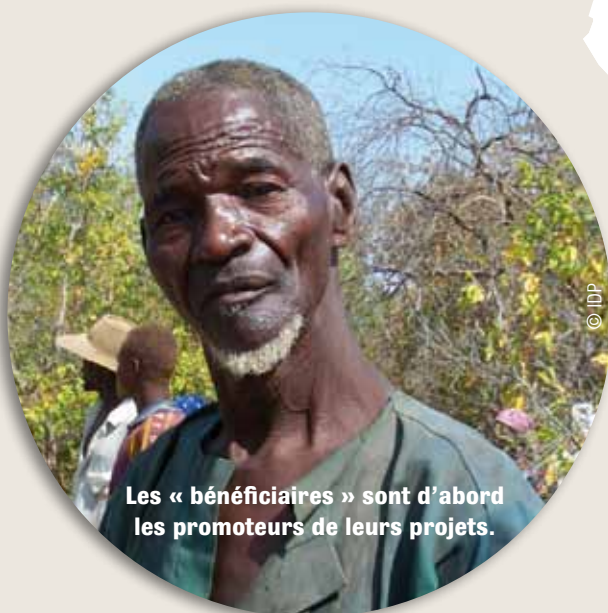
Les « bénéficiaires » sont d'abord les promoteurs de leurs projets.

O.G. : « La participation permet aussi au bénéficiaire de faire ses comptes. Par exemple, un paysan qui investit pour tester de nouvelles semences pourra faire la balance entre le coût de celles-ci et ce qu'elles lui rapportent. Si elles lui sont offertes, cette analyse économique est impossible. Par ailleurs, il faut veiller à ce que les projets n'exigent pas des bénéficiaires des investissements trop importants, auquel cas ils ne pourraient être reproduits par d'autres. Cela serait en contradiction avec notre approche, qui mise sur un effet tache d'huile. »