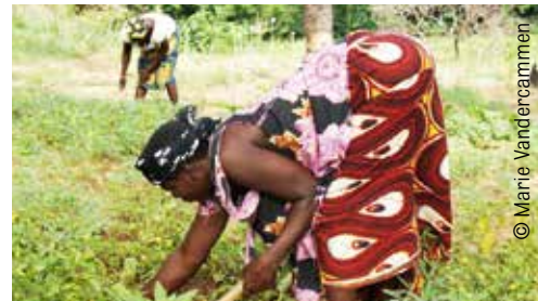
Le pois d'angole permet de réduire la part d'intrants agricoles à base de pétrole.

Le défi est sérieux car de nombreux éléments constitutifs de notre mode de vie reposent, directement ou indirectement sur le pétrole. Celui-ci se retrouve par exemple dans de nombreux intrants agricoles. Sans pétrole, cultiverons-nous encore ces immenses champs qui remplissent nos silos à grains ? Les pratiques agro-écologiques semblent attester qu'une alternative existe, mais elles nécessitent de changer complètement la manière de concevoir l'agriculture.