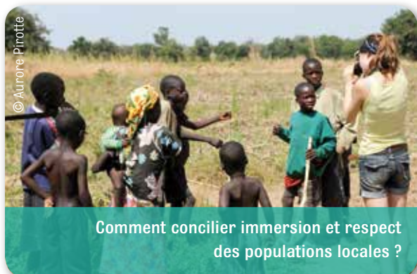
Comment concilier immersion et respect des populations locales ?

Partenaires naturels de nos actions à l'échelle nationale, d'autres ONG belges œuvrent fréquemment aux côtés d'Iles de Paix dans ses actions éducatives. PROTOS, ONG flamande spécialisée dans la gestion de l'eau, a ainsi collaboré avec Iles de Paix pour la création du site internet « Nous, on se mouille ! ». Destiné aux enseignants du secondaire technique et professionnel, ce site propose aux professeurs des ressources pédagogiques liées à la thématique de l'eau dans les pays du Nord comme du Sud. Dans le même registre, Iles de Paix a également traduit et adapté un autre site internet réalisé par PROTOS au sujet des changements climatiques, « Injustices climatiques ».