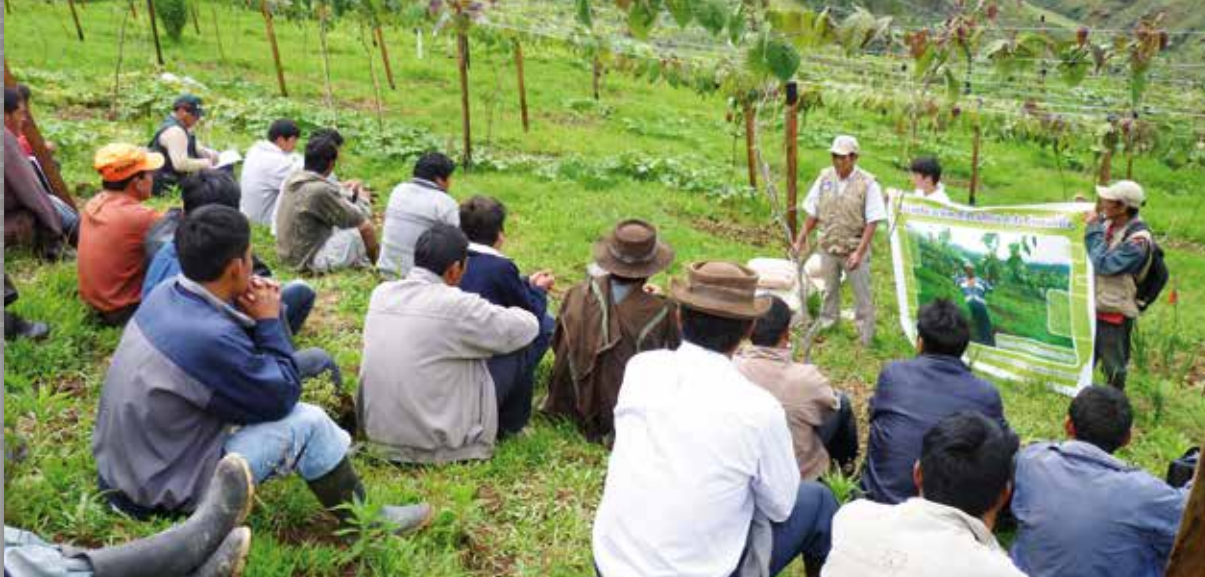
Des paysans péruviens suivent une formation sur la culture de la grenadille.