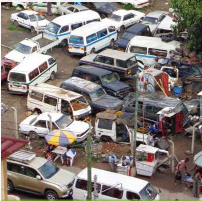
Les grandes villes africaines, marchés privilégiés des véhicules de seconde main.

La question des réserves de pétrole sous Terre occupe les esprits depuis de nombreuses années. En 1980, on les estimait à 700 milliards de barils et on prédisait qu'on aurait consommé la dernière goutte en... 2015. En 1998, on estimait à 1021 milliards de barils le pétrole encore enfoui. En 2013, ce chiffre est revu à la hausse : 1600 milliards de barils. La fin du pétrole serait-elle un mirage qui s'éloigne à mesure que l'on s'en approche ?