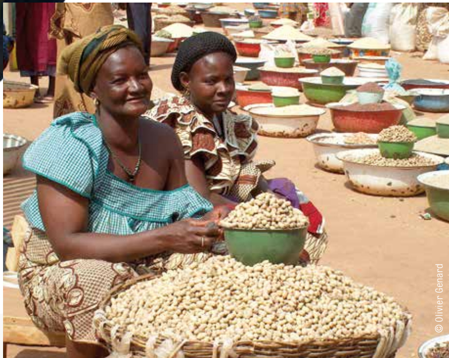
Combien de temps le marché de Fada N'gourma satisfera-t-il ses utilisateurs ?

De manière générale quatre éléments affectent la capacité d'une société à répondre aux besoins des personnes qui la composent : la taille de sa population, la définition qu'elle a de ses besoins, les ressources disponibles et sa capacité à transformer ces ressources en réponses à ses besoins.