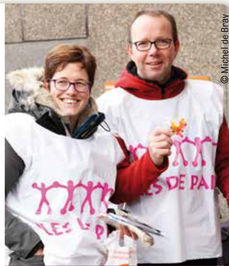
Vente de modules à Schaerbeek

Le début d'année a été riche en émotion pour Iles de Paix puisque nos équipes de bénévoles ont fait preuve d'une motivation époustouflante lors de notre campagne de vente de modules. Les conditions climatiques n'ont pas refroidi l'élan de solidarité et la fidélité des volontaires alors, du fond du cœur, MERCI à toutes les personnes qui se sont mobilisées pour faire de cette campagne un succès !