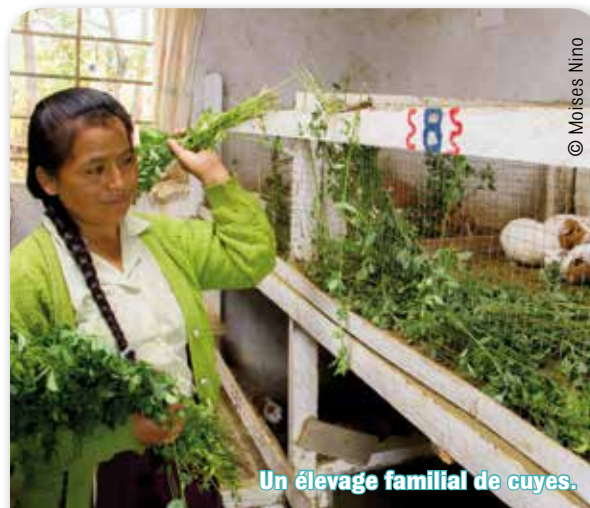
Un élevage familial de cuyes.

Par respect pour ces enfants, nous avons fait le choix de laisser leurs témoignages au naturel, sans les doubler par un enfant de chez nous, ce qui serait aussi à nos yeux truquer la réalité. Par ailleurs, il nous a semblé essentiel de mettre en avant les bénéficiaires des projets eux-mêmes plutôt que de parler en leur nom. ●