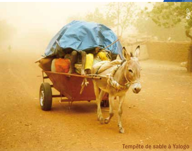
Tempête de sable à Yalogo

Des hommes, des femmes, des enfants, d'une incroyable diversité, se lèvent le matin, travaillent, apprennent, commercent, s'émerveillent, se lavent, souffrent, cuisinent, fument, labourent, défèquent, se chamaillent, dorment, rient, rendent la justice, l'attendent, lisent, se préoccupent, aiment, écrivent, surfent sur Internet, comptent, voyagent, cherchent l'eau, découvrent, pêchent, meurent, construisent, enragent, soignent, mendient, creusent le sol, etc.