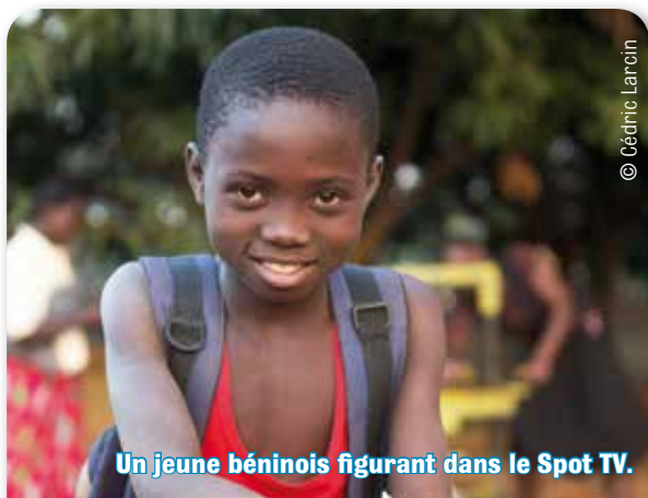
Un jeune béninois figurant dans le Spot TV.