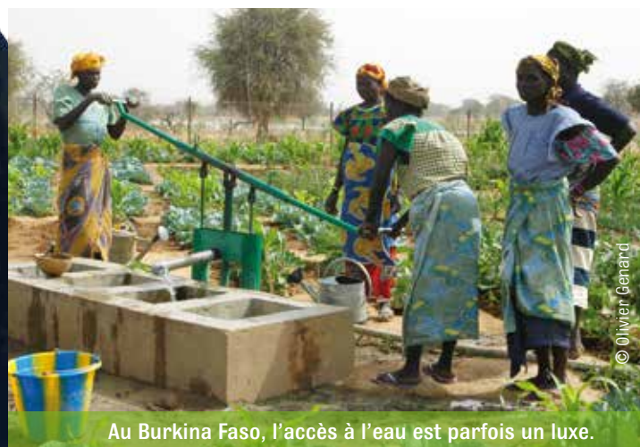
Au Burkina Faso, l'accès à l'eau est parfois un luxe.

Une situation insoutenable ? Oui, d'autant plus que la croissance démographique n'est pas seule responsable de la pression sur les ressources hydriques. L'agriculture et l'industrie auront aussi de plus en plus soif. Aujourd'hui, 70 % des