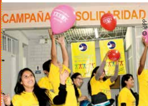
Soirée de lancement de la campagne 2015

Avec un mois d'avance sur la campagne belge, c'est à la mi-décembre que s'est déroulée la 2 e campagne de ventes de modules d'Islas de Paz Perú dans le district de Huánuco. Suite à la soirée de lancement réunissant une soixantaine de personnes parmi lesquels d'anciens et d'actuels membres de l'organisation, des partenaires ainsi que de nombreux étudiants sensibilisés à l'action d'IdPP au sein de leurs universités, l'évènement s'est étalé sur un week-end. Plus de 50 bénévoles ont ainsi pris part à l'opération dans trois centres commerciaux de Huánuco. Et la bonne nouvelle c'est que l'enthousiasme des populations de Huánuco, déjà pressenti l'année passée, s'est largement confirmé ! Les sommes récoltées restent certes modestes en comparaison de la campagne belge (l'objectif 2015 était de 10 000 soles, soit environ 2 700 euros), mais les réactions positives des participants témoignent de la notoriété grandissante d'Islas de Paz Perú.